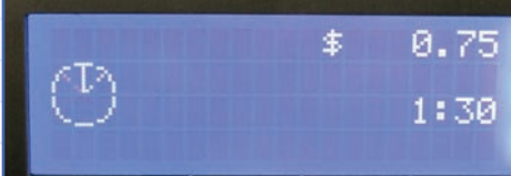
AFFICHAGE DU TEMPS