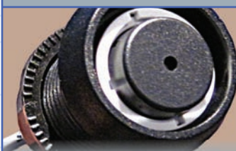
AVERTISSEUR DE FIN DE CYCLE