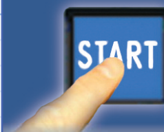
OPTION DE DÉPART