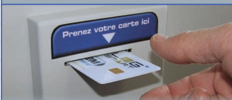
VENTE DE CARTE U-SMART