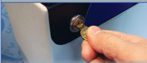
MODE GRATUIT AVEC LIMITE