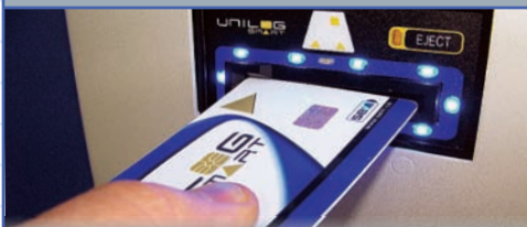
LECTEUR DE CARTE U-SMART